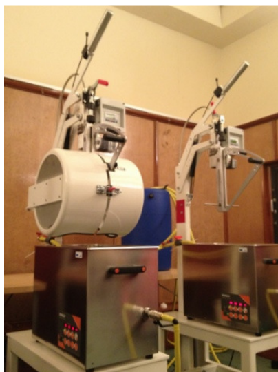
Le macchine per la pulizia dei dischi e due vasche Soltec durante una fase dell'installazione

Esso infatti prevede un primo bagno ultrasonico con detergente specifico e acqua demineralizzata a temperatura ambiente seguito da un ulteriore bagno sempre in acqua demineralizzata a temperatura di 25 gradi centigradi.