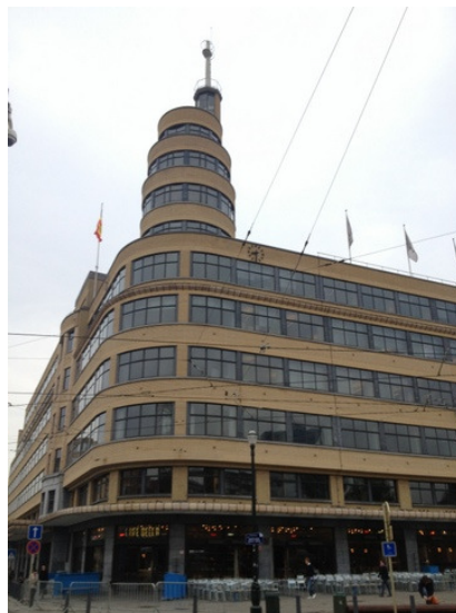
Il palazzo della Radio di Bruxelles, sede della società MEMNON

La società MEMNON, sulla scorta dell'esperienza sviluppata dalla Fonoteca Nazionale Svizzera, ha voluto dotarsi dello stesso sistema di pulizia ad ultrasuoni rivolgendosi allo stesso fornitore, la ditta italiana Bairoalto Design che vista la delicatezza del compito e la necessità di disporre di un prodotto efficace, performante e affidabile, ha selezionato l'azienda Soltec come fornitrice per le vasche ad ultrasuoni, scegliendo in particolare la serie SONICA S3.